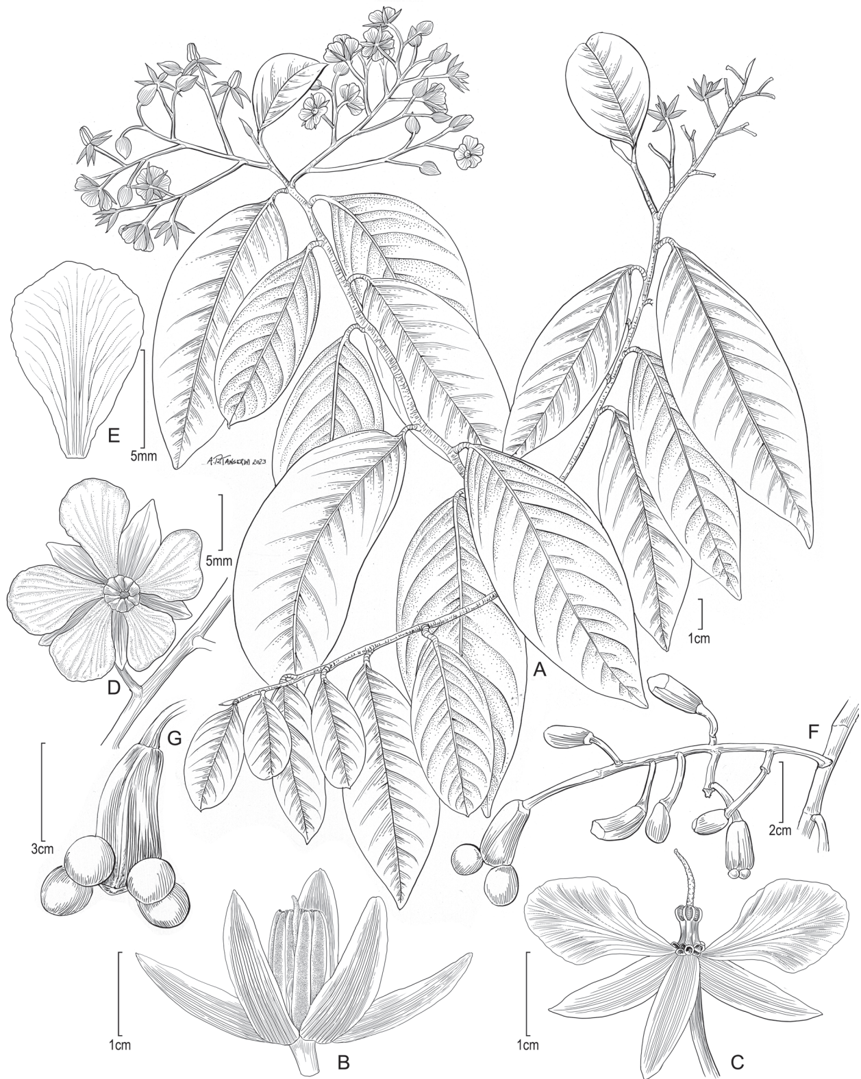
FIGURA 1. Ouratea chepelii S.M. Niño et al., sp. nov. A , Hábito, mostrando rama con inflorescencias y hojas reflejas. B , Flor que muestra sépalos, anteras y punta de estilo (sin pétalos). C , Flor que muestra ginóforo y estilo (se eliminan dos sépalos y tres pétalos). E , Pétalo. F , Infrutescencia. G , Fruto maduro, que muestra un carpóforo (torus) con cuatro carpelos globosos (A–E, Niño y Canelón 6668; F, G, Niño y Canelón 6519).