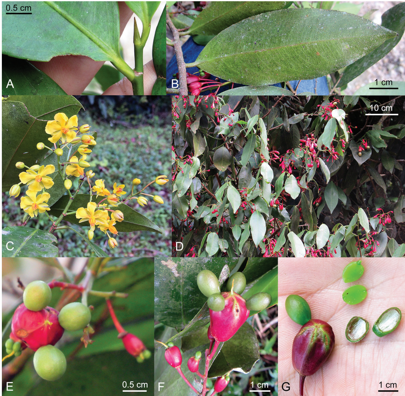
FIGURA 3. Algunos detalles de Ouratea chepelli S.M. Niño et al. en vivo. A , Detalle de la stípula en ramas terminales. B , Hoja y peciolo por envés. C , Inflorescencia con estambres que resaltan por su color naranja (Niño y Canelón 6668). D , Lámina de las hojas y la infrutescencia colgantes. E , Carpóforo (torus) (rojo brillante) desde arriba con carpelos globosos (verde brillante). F , Carpóforo (torus) desde el lado con estilo persistente y carpelos (en vida el carpóforo esta colgante). G , Carpóforo (torus) con un carpelo o adjunto y otro carpelo dividido para mostrar la semilla (Niño y Canelón 6519).